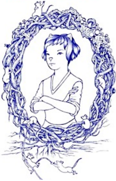
Illustration Marie-Claire Redon